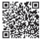
福岡デザインアワード特設 WEB サイト