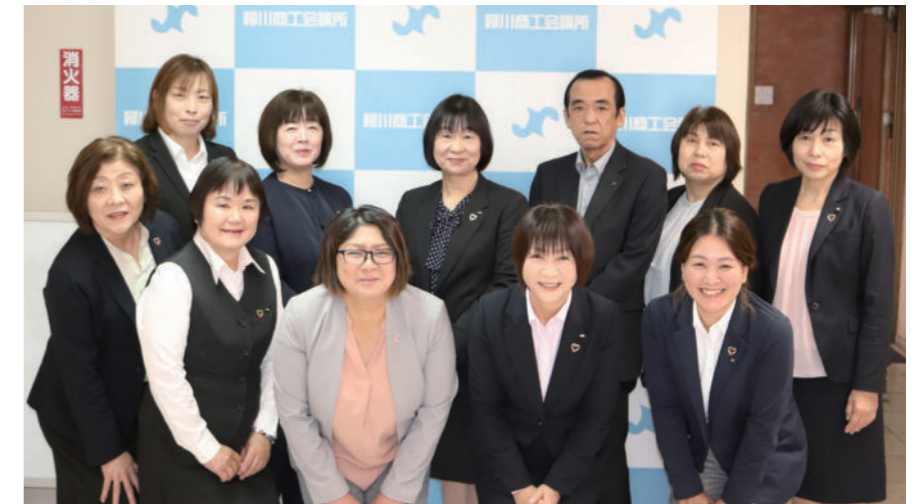
▲柳川営業所 推進員のみなさま

「商工会議所福祉制度」とは、経営者・役員の皆様の保障や退職金準備のほか、入院・介護・老後に備えた様々な保障ニーズに対応するものです。