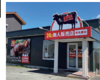
柳川市三橋町白鳥486-2

冷凍餃子 近日発売予定! 冷凍餃子を作る機械を購入しました。 佐賀牛を使った冷凍餃子を現在試作中です。お楽しみに!!